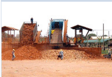
La racine de manioc est prête à être transformée