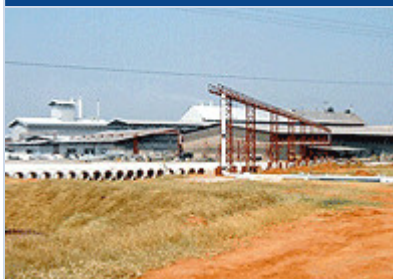
Pipeline de biogaz en cours de construction avec, en arrière-plan, les installations SWI